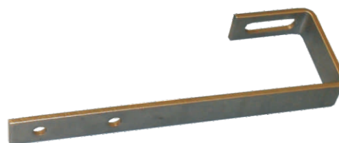
Schrägdach Montage-Set – flache Abdeckung